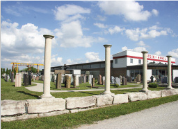
Das Firmengelände in Leutershausen inklusive Musterfriedhof, auf dem auch Führungen stattfinden