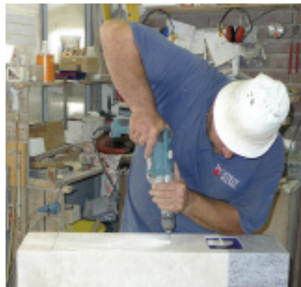
Rechtes Bild: Ornamente oder das Verzieren mit Swarovski-Steinen sind bei Stein Hanel Handarbeit.