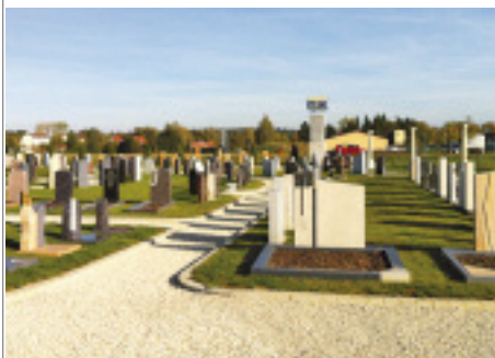
In der Filiale in Wassertrüdingen wird auf 3000 m 2 Ausstellungsfläche in Parkambiente die Produktpalette des Steinmetzbetriebs präsentiert.