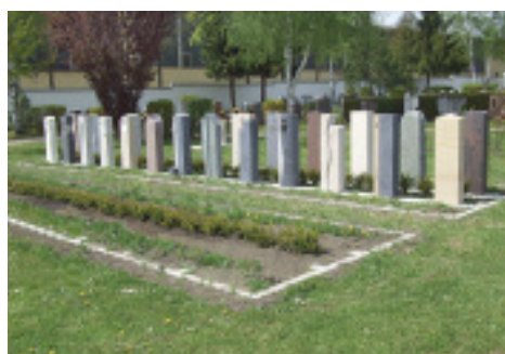
Auf dem Friedhof in Bad Windsheim hat die Firma Stein Hanel ein ganzes Urnengrabfeld mitgestaltet.