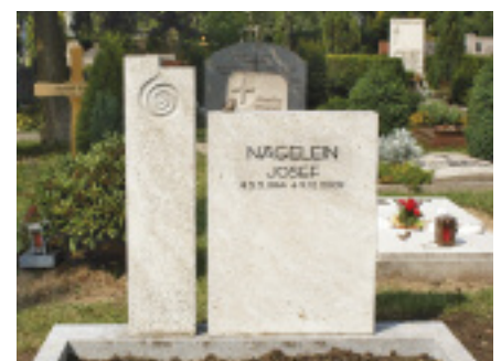
Das Unternehmen bietet auch Grabmale aus heimischen Materialien wie Muschelkalk (s. Foto) oder Flossenbürger Granit an.